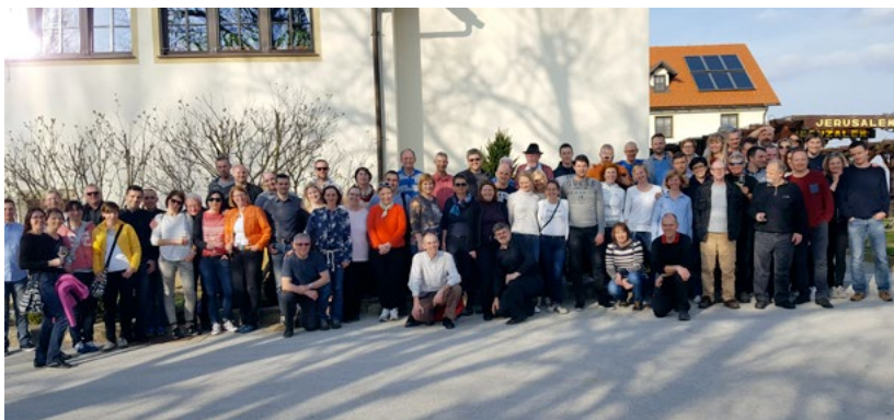
Zaposleni na obisku v Jeruzalemu ob 40. letnici postavitve prve radijske nadzorne postaje, marec 2017

Agencija si prizadeva zagotavljati dostopnost in kakovost univerzalnih storitev vsem prebivalcem Slovenije po dostopnih cenah in neodvisno od geografske lokacije, učinkovito konkurenco na trgu in tekmovanje med ponudniki storitev elektronskih komunikacij in pošte. Zagotavlja in nadzira učinkovito rabo radiofrekvenčnega spektra ter številskega prostora in pravičen ter enakopraven dostop do javne železniške infrastrukture. Zavezana je tudi k zagotavljanju enakih pogojev za delovanje izdajateljev radijskih in televizijskih programov ter ponudnikov drugih avdiovizualnih vsebin ter zagotavljanju delovanja elektronskih komunikacij in uporabe radiofrekvenčnega spektra za nudenje storitev tudi v času izrednih razmer. Ves čas si tudi prizadeva